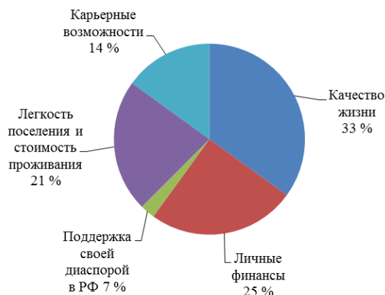
Рисунок. Приоритеты различных аспектов жизни в России представителей этнического бизнеса, %